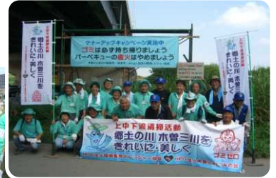
長良大橋～伊勢湾 *木曾三川ごみの会作成