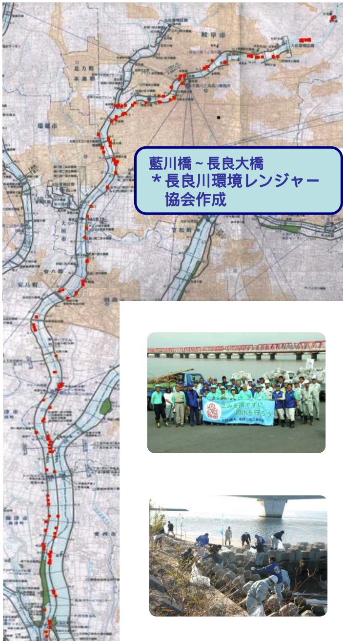
藍川橋～長良大橋 *長良川環境レンジャー協会作成

この2年間で清掃活動をしたり、パトロールをした結果を今回「ゴミマップ図」としてまとめました。川にゴミがこんなに捨てられていることがわかりましたのでお知らせします。