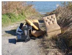
不法投棄された家具