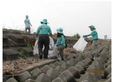
長島町（桑名市）にて