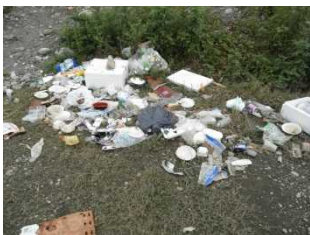
片づけされず放置されたバーベキューの残骸