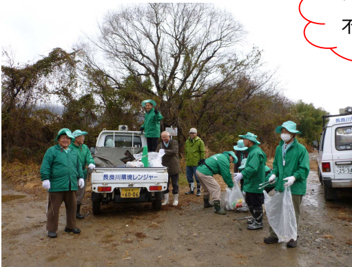
天候の悪い中、皆さんお疲れ様でした！