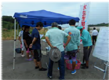
▲犬山頭首工地点にて