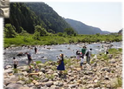
▲関市池尻 鮎の瀬橋地点