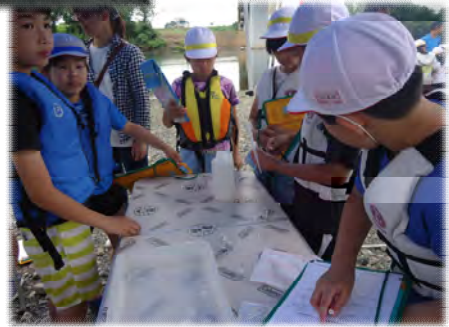
▲水生生物仕分け作業の様子