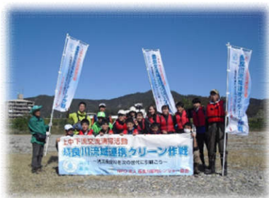
▲岐阜市会場（E ボートで漂着ゴミ回収）