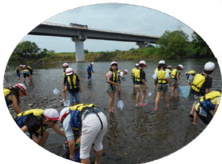
▲水生生物採集の様子▼