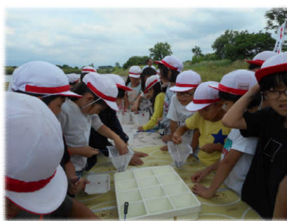
▲水生生物仕分け作業の様子▼