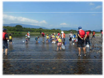
▲平野庄橋地点にて