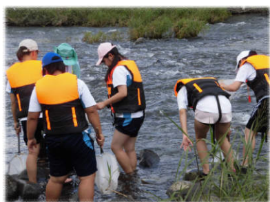
▲犬山頭首工地点にて