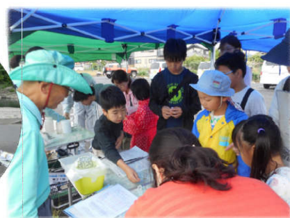
▲郡上市白鳥町 白山文化の里長滝道の駅地点