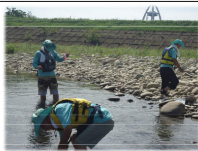
▲平成川島橋地点にて