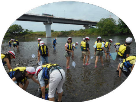
▲水生生物採集の様子▼