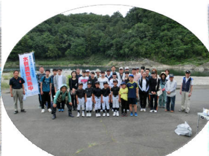
▲関市池尻4 川の瀬橋地点