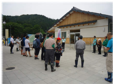
▲郡上市白鳥町 白山文化の里長滝道の駅地点

6月7日(日)、長良川流域10地点、木曾川1地点、揖斐川1地点の合計12地点において、今年も各流域の皆さんと一緒に河原の水質調査・透明度調査・自然度調査などの環境調査を実施しました。例年であれば汚染調査（ごみ調査）も実施しておりましたが、新型コロナウイルス感染症拡大防止対策として、活動時間の短縮、活動人数の制限を行ったため、汚染調査は省略しました。この調査は河川の環境保全を図るため、川の現状を把握すると共に、流域の人達と交流を図り、河川愛護の普及に努めるものです。調査を通じて、流域の皆さんと交流を図りながら、それぞれの地域の川の現状を把握し河川環境保全の大切さを再認識しました。（参加者：65名）