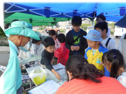
▲羽島市小熊町 東西橋地点