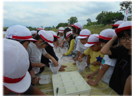
▲水生生物仕分け作業の様子▼