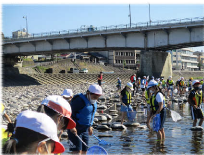
▲水生生物採集の様子▼