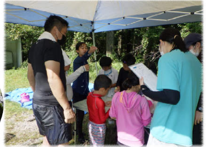
上流域では、キャニオニング体験をしたり、生き物調査、パックテストによる水質調べをしました