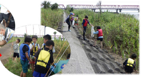
下流域（桑名市）では、地引網体験や魚釣り・しじみとりをしたり、多くの漂着ゴミを回収しました