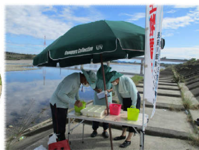
▲平成川島橋地点にて