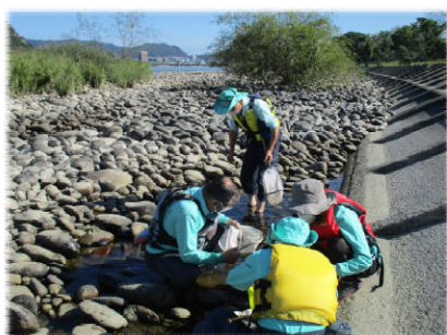
▲犬山頭首工地点にて