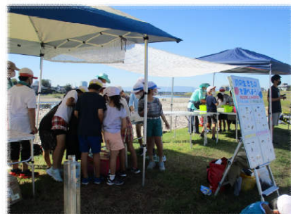
▲水生生物仕分け作業の様子▼