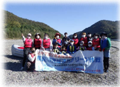
▲岐阜市会場（E ボートで漂着ゴミ回収）