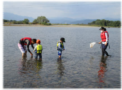
▲平野庄橋地点にて