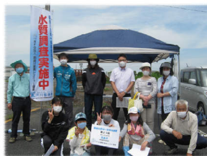
▲郡上市白鳥町 白山文化の里長滝道の駅地点